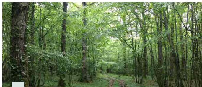
La Forêt de Poulasnon

Amélioration des peuplements : Travaux visant à améliorer la qualité intrinsèque du bois (détourage, élagage, taille de formation).